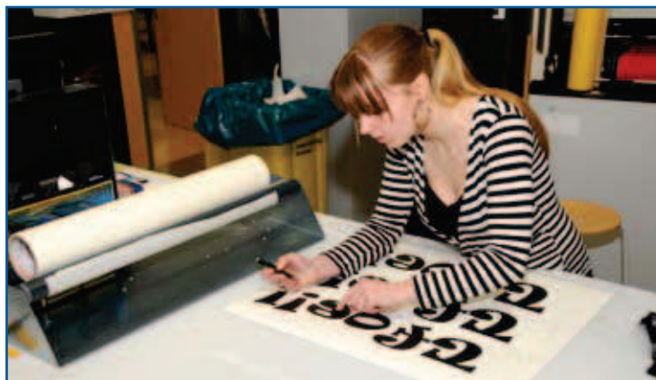
Concentratie bij het uitsnijden van de letters

Regelmatig organiseert de school excursies naar bedrijven. Daar zijn ze bijvoorbeeld getuige van de ins en outs van een graveerbedrijf.