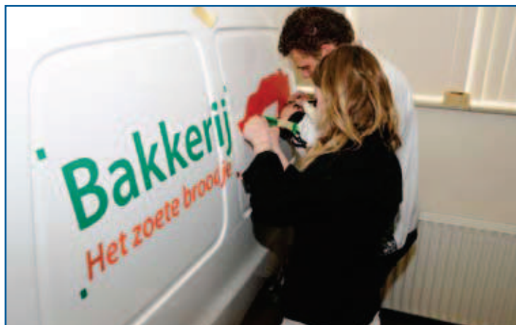
Het beletteren van een auto vraagt om oefening

wennen om een stagiair over de vloer te hebben. Niet overal bestaat een opleidingstraditie. Maar in het algemeen zijn bedrijven enthousiast. Ik verwacht dat een aantal leerlingen – om in signtermen te blijven – er zeker zal blijven plakken.”