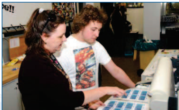
De leerlingen kunnen voor alle aspecten op school terecht